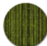
Fôret de Bambous