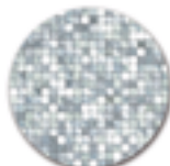
Pâte de Verre